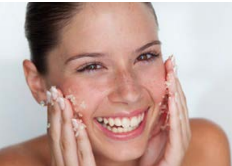
Een scrub of gommage verwijdert de dode huidcellen en stimuleert de bloedcirculatie. Je huid ziet er weer gladder, gezonder en frisser uit.

De 'uitdrogende' werking van winter en kou beperkt zich niet tot de huid maar heeft zijn impact op het hele lichaam. Zorg er daarom voor dat je iedere dag voldoende water drinkt. Water, of zuiverende kruiden-thee, is een goede manier om je lichaam wakker te schudden, te zuiveren, om lichaam en geest weer op gang te krijgen.