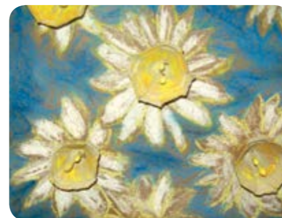
De kroonblaadjes van de paaslelies of narcissen knip je uit een eierdoos, de stamper maak je van oorstokjes of kleurrijke knopen.

Paasvakantie, moederdag, lente- of communiefeest, ... Ideaal om de creatieve kriebels en fantasie bij je kids te prikkelen. Maak je eigen geschenk of (paas)decoratie en... win!