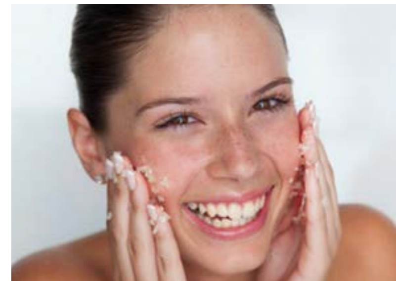
Een scrub of gommage verwijdert de dode huidcellen en stimuleert de bloedcirculatie waardoor de huid er direct weer gladder, gezonder en frisser uitziet.

Je houdt je huid soepel en helpt de natuur een handje bij het 'vernieuingsproces' van je huid. Om de drie tot vier weken vernieuwen alle cellen op je huid. De oude cellen worden vaak afgevoerd tijdens het wassen en het aantrekken van kleding. Niet alle oude cellen worden echter verwijderd. Daarom is het belangrijk om je huid regelmatig te scrubben.